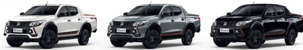
[W54] WHITE PEARL (P)